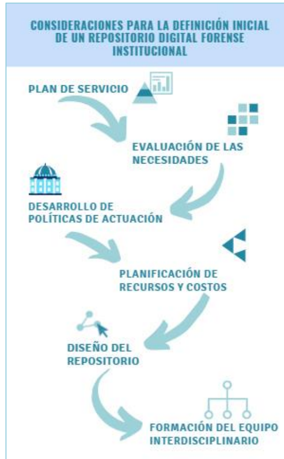
Fig. 1. Consideraciones para la definición inicial del repositorio institucional.