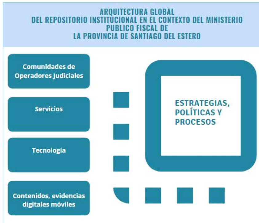
Fig. 2. Arquitectura global del repositorio institucional.

conjunto de fases, aunque el proceso puede requerir eventualmente volver a alguna de las fases previas dependiendo de los resultados obtenidos y el avance de la IPP.