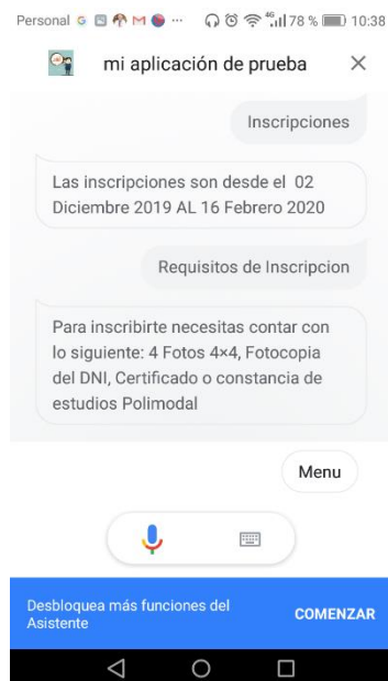
Fig. 4. Intenciones Inscripción y Requisitos