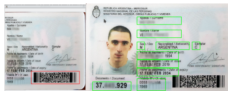
Figura 3. Identificación de campos y extracción de información.